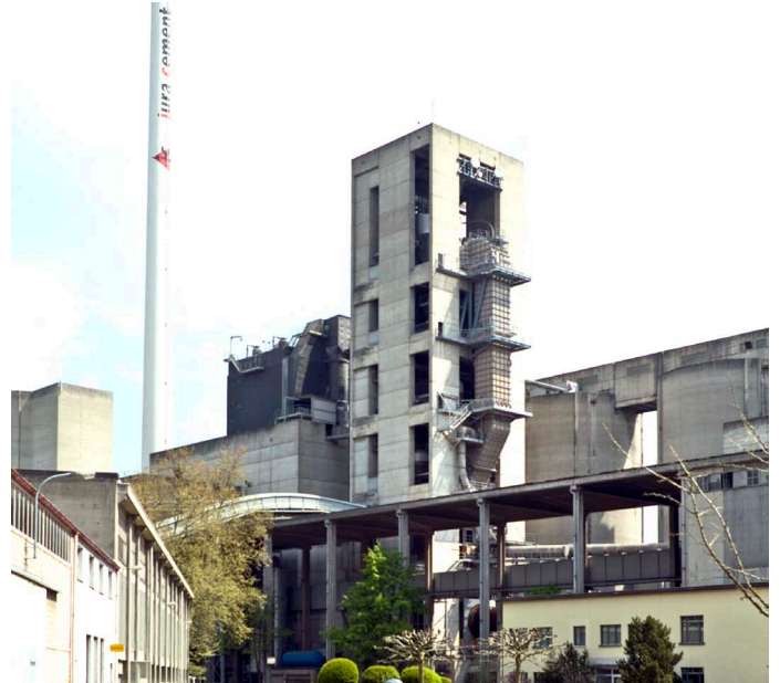
Zementwerk von Jura Cement in Wildegg, Schweiz

Bei Jura Cement, dem zweitgrößten Zementhersteller in der Schweiz, wurde ein 25 Jahre alter Kaskadenumrichter durch einen drehzahlgeregelten Antrieb von ABB ersetzt. Der ACS 2000 mit einer Nennleistung von 550 kW regelt das Abluftgebläse des Klinkerkühlers im Zementwerk von Jura Cement in Wildegg, Schweiz.