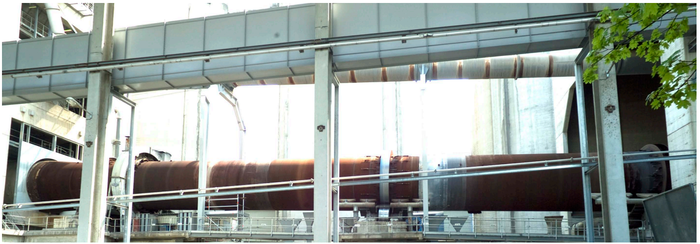
Zementofen im Zementwerk von Jura Cement in Wildegg, Schweiz

Der Kaskadenantrieb, der zuvor das Klinkerkühler-Abluftgebläse gesteuert hat, wurde 1984 von BBC gebaut. Er wurde nun durch einen Mittelspannungs-Frequenzumrichter ersetzt; unter anderem auch um einen größeren Drehzahlbereich von 0 U/min bis 1000-120 U/min zu erhalten. Der Kaskadenantrieb wurde mit mindestens 300 U/min betrieben, denn der Wirkungsgrad fiel bei geringerer Drehzahl erheblich ab. Durch den eingeschränkten Drehzahlbereich wurden einige Produktionsphasen beeinträchtigt, was eine große Energieverschwendung zur Folge hatte.