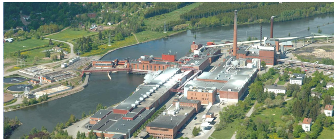
Fábrica de papel do Grupo Myllykoski em Anjalankoski, Finlândia.