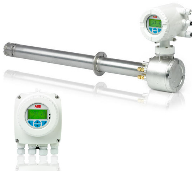
Bilden ovan: ABB:s nya O 2 -analysator, AZ20, är stabil med autokalibrering och avancerad diagnostik. Läs mer på www.abb.se/instrumentation .